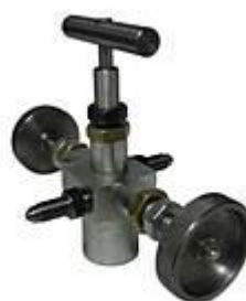
разрядная головка для перевода пробы